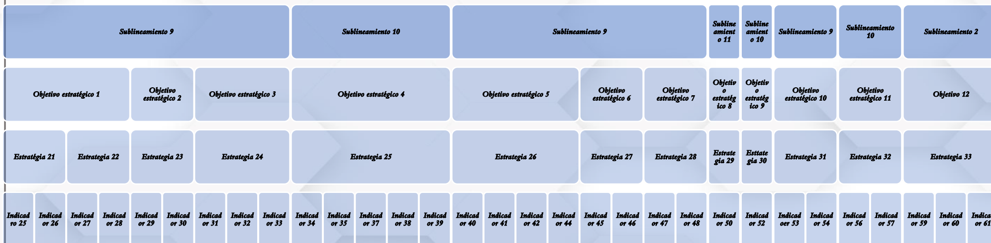
Figura 3: Diagrama de indicadores vinculados al proceso integral de Formación