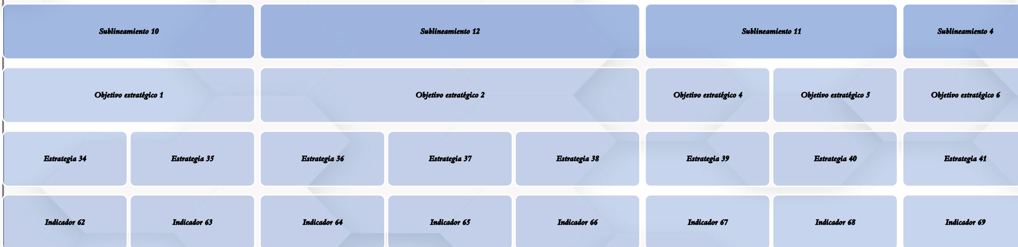
Figura 4: Diagrama de Indicadores vinculados al proceso integral de Vinculación con la comunidad