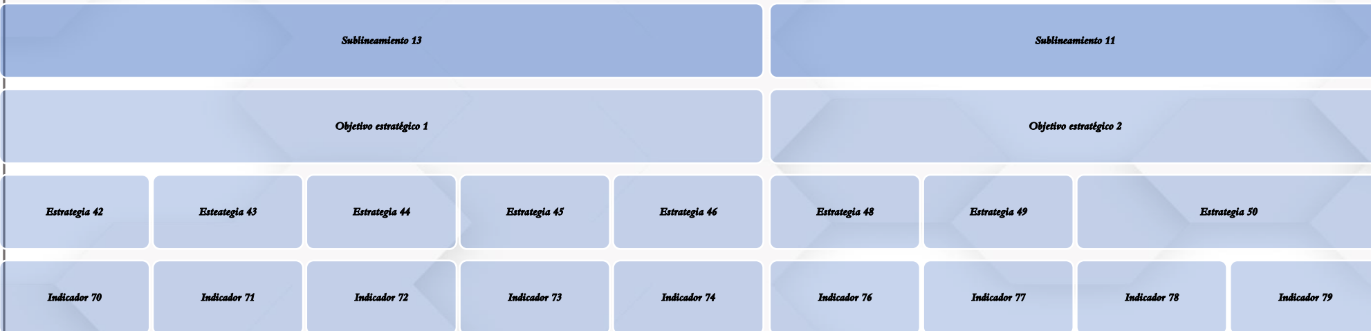
Figura 5: Diagrama de Indicadores vinculados al proceso integral de Investigación